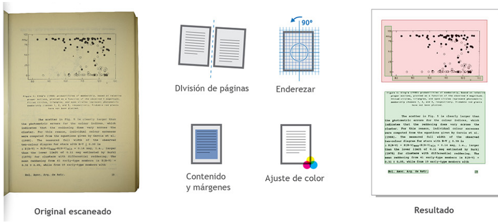
Figura 2: El software SCANTAILOR ADVANCED permite la manipulación de las imágenes obtenidas. Dibujos realizados por Lucas Folegatto.